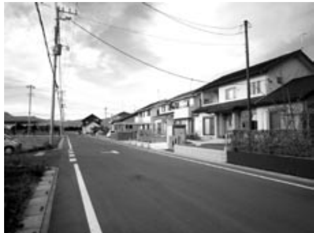
◀ 「緑台」となる小前田区画整理地

小前田駅北西部地区の区画整理が完了して、新たな町名が検討されてきましたが、住民皆様の要望を検討委員会で協議され町名は「緑台」で決定し今議会でも可決承認されました。