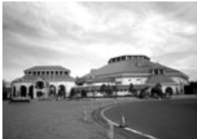
▲温水室内プール パティオ